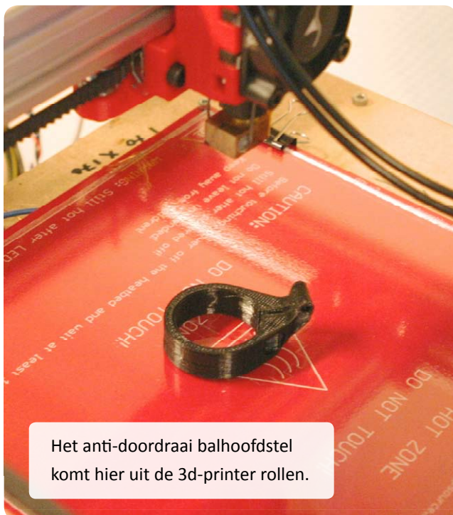
Het anti-doordraai balhoofdstel komt hier uit de 3d-printer rollen.